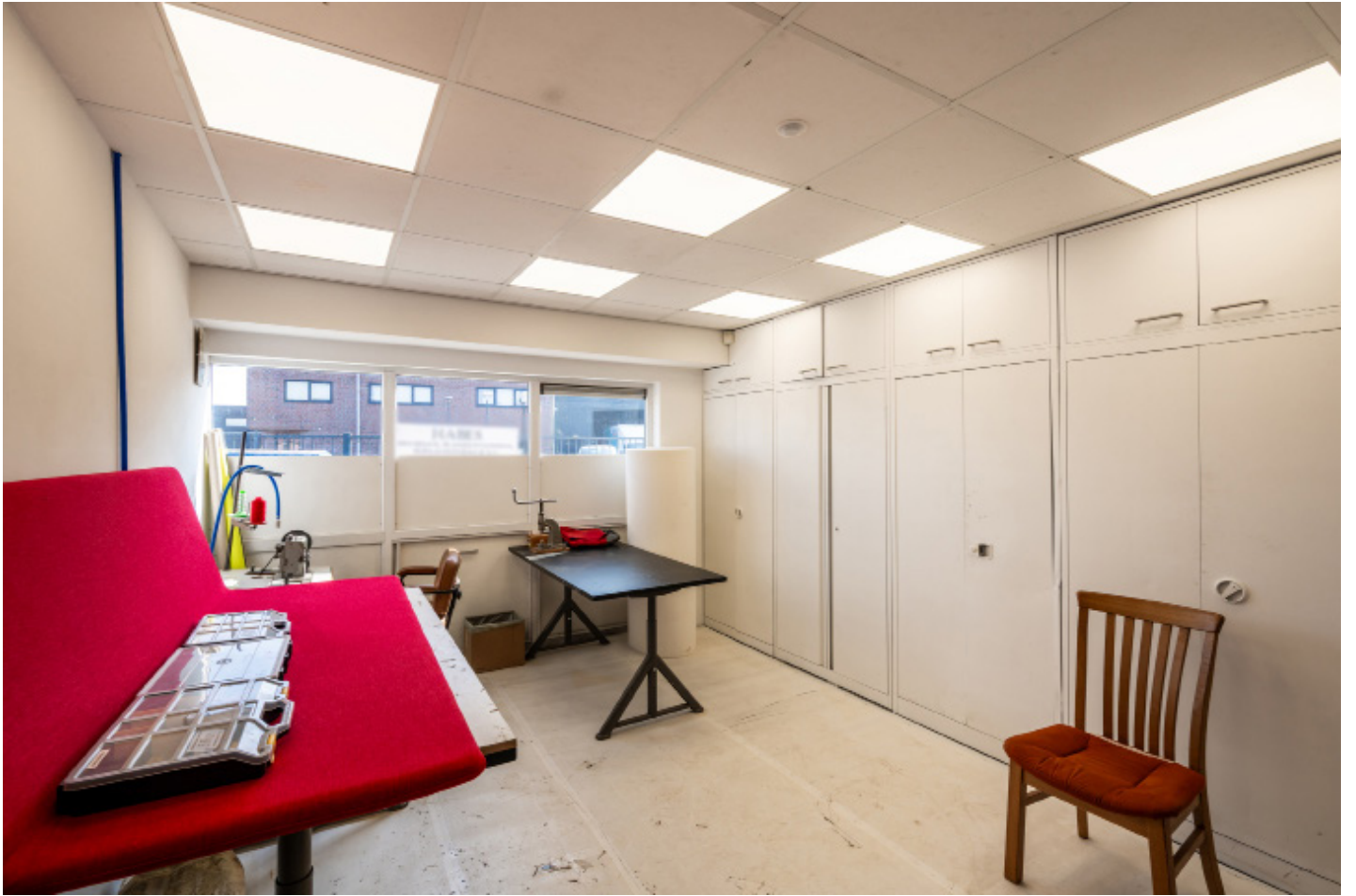
KANTOOR BIJ WERKPLAATS