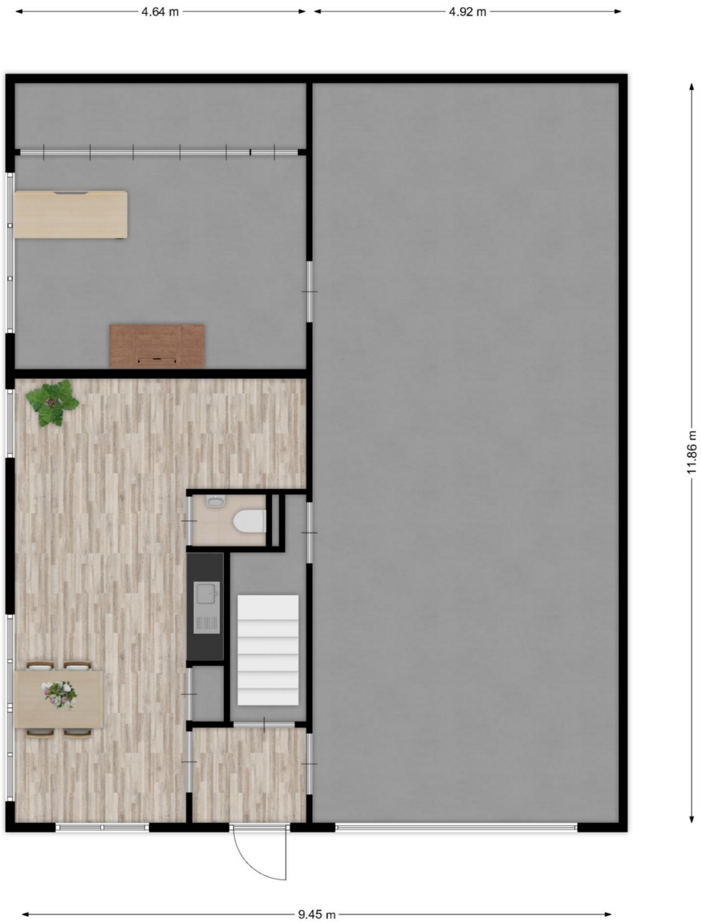
Angelenweg 80N te Oss - Begane grond Plattegronden zijn ter indicatie en kunnen afwijken van de werkelijkheid