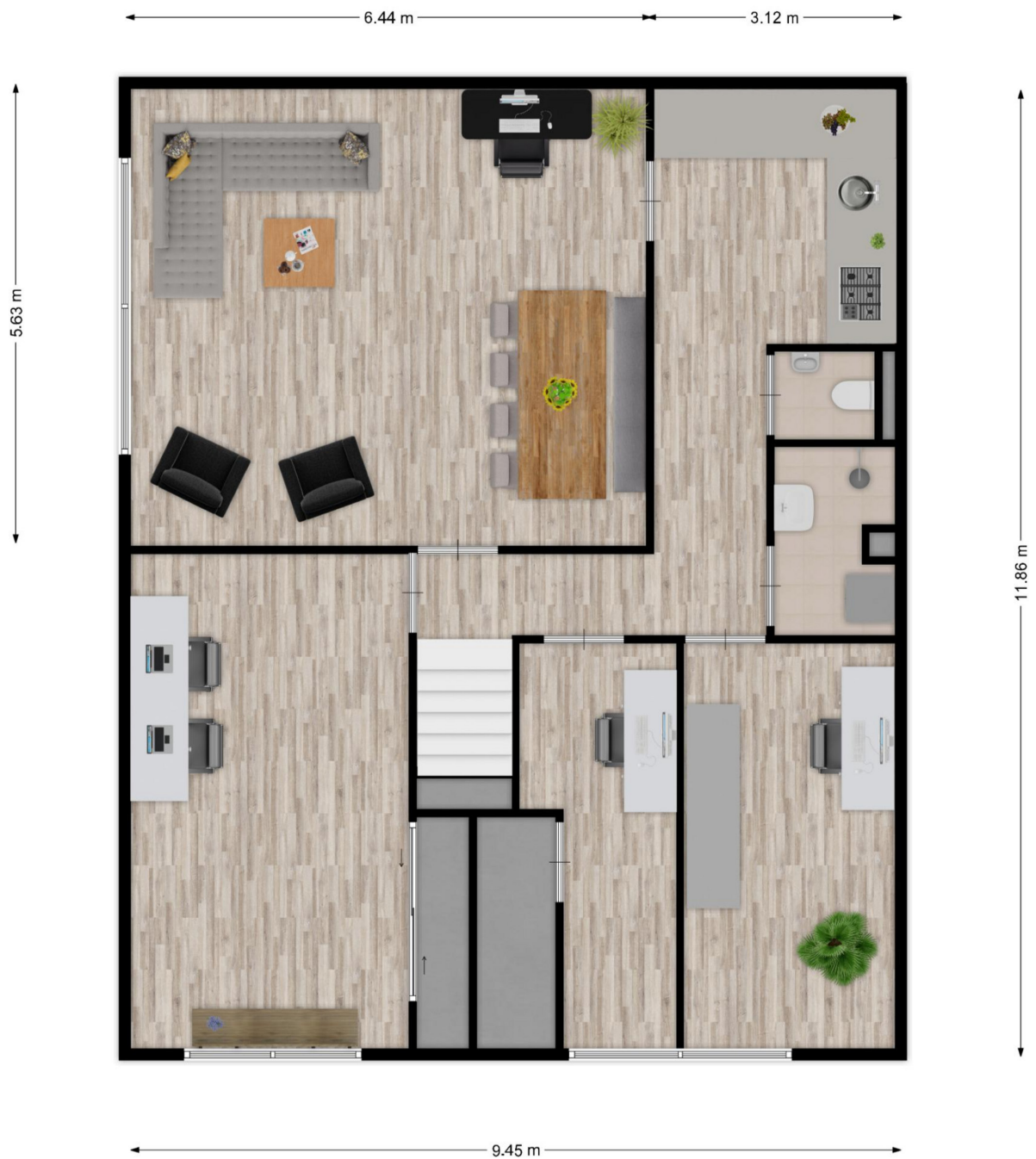
Angelenweg 80N te Oss - Eerste verdieping Plattegronden zijn ter indicatie en kunnen afwijken van de werkelijkheid